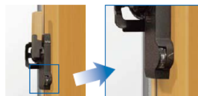
ダイヤル錠付きクレセント