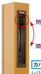
カバーが開いている状態