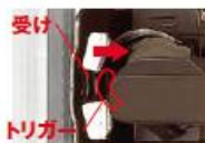
障子が閉まっている状態