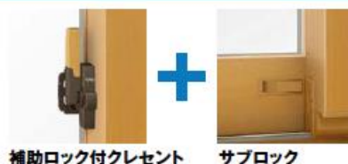
補助ロック付クレセント

シンフォニー ウッディ/マイルドでは、2ロックを標準装備しています（一部品種を除く）。これにより、侵入までの時間を稼ぎ、侵入をあきらめさせる心理効果も期待できます。